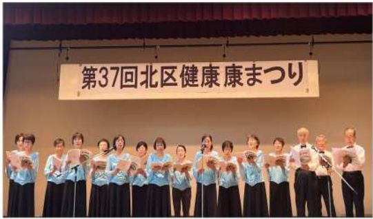
昨年の健康まつり