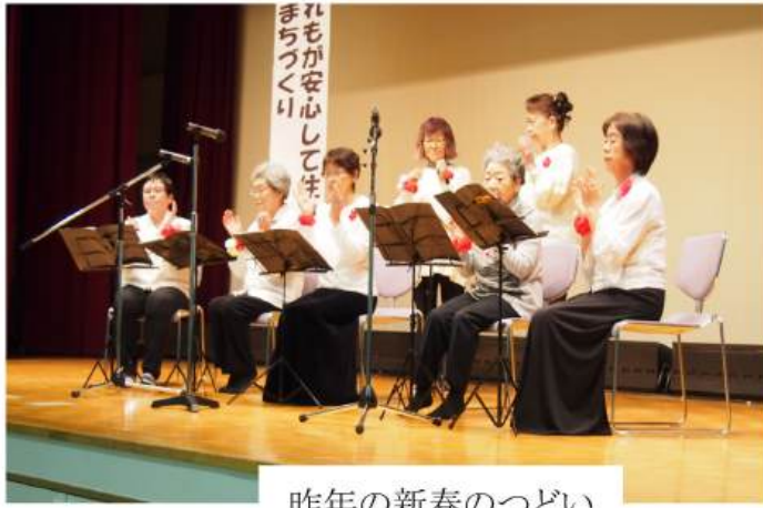
昨年新春のつどい

ぼぶら会館1階会議室にて月1回、第2火曜日10時半から11時まで8名で活動しています。今年1月18日の新年会ではカスタネット花川サークル結の8名の皆さんと合同で『高原列車は行く』、『ブルーシャトウ』、『絹の靴下』3曲をうきうきルンルンで楽しく演奏しました。指を動かすので脳トレにも大変有効です。見学はいつでも大歓迎です。